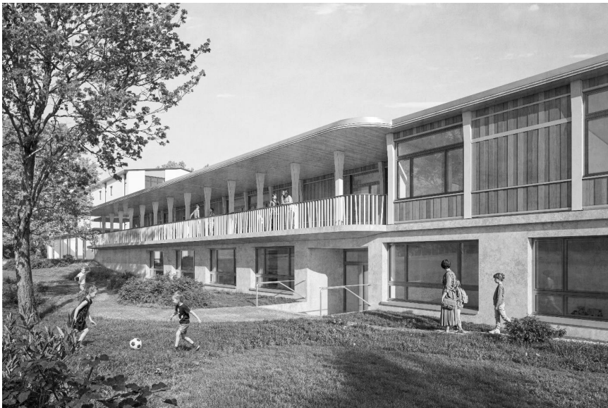
Abbildung 2: Visualisierung Tageschule und Zugang Kindergärten und Mehrzweckraum von Norden