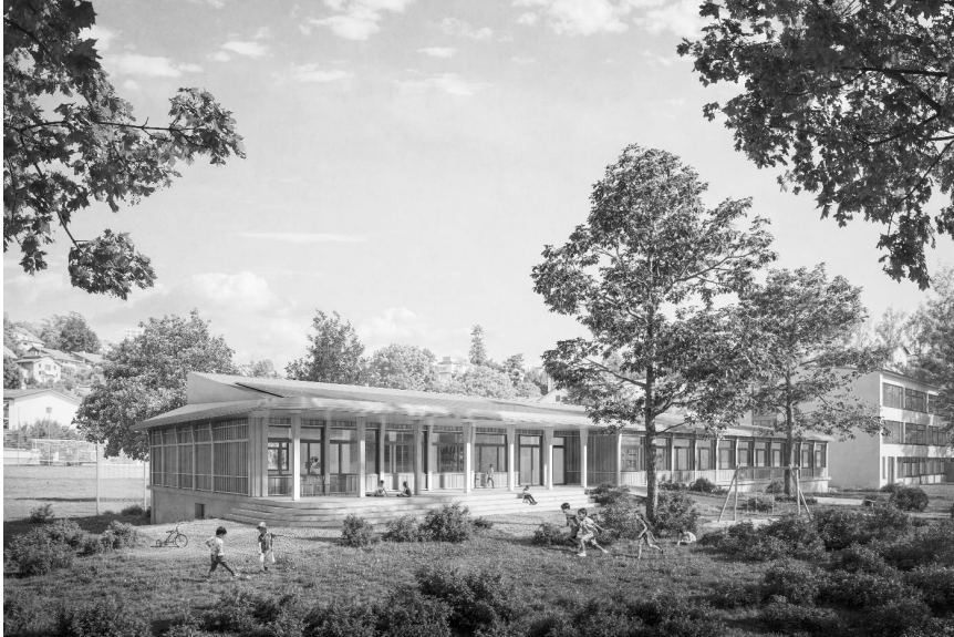
Abbildung 1: Visualisierung Kindergärten und Mehrzweckraum von Süden