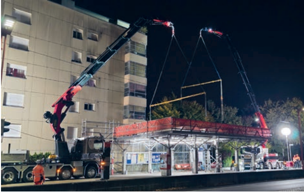
Anhebung des Dachs am Bahnhof Unterzollkofen