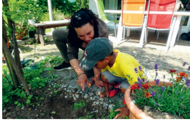
Im Garten des KARIBU-Frauentreffs