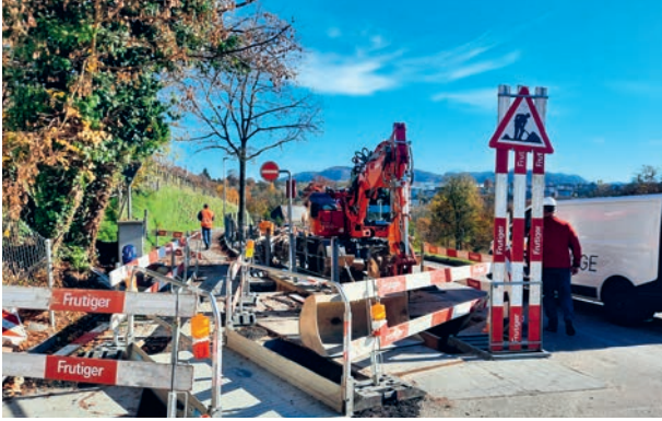
Abwasser- und Wasserleitungersatz an der Reichenbachstrasse