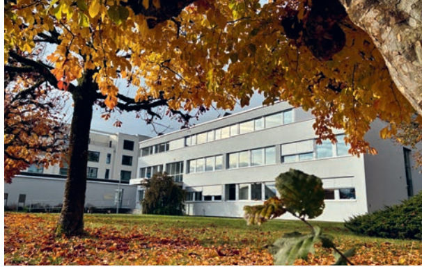
Herbststimmung vor der Gemeindeverwaltung