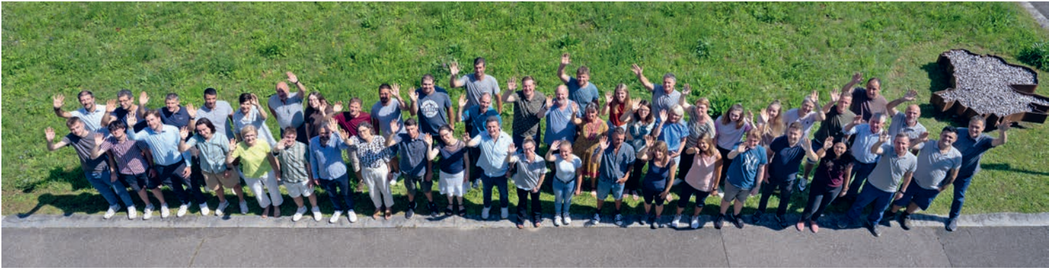
Mitarbeitende der Gemeindeverwaltung Zollikofen

An der Jahresabschlussfeier wurden dem Gemeinderat zwei Postulate übergeben: