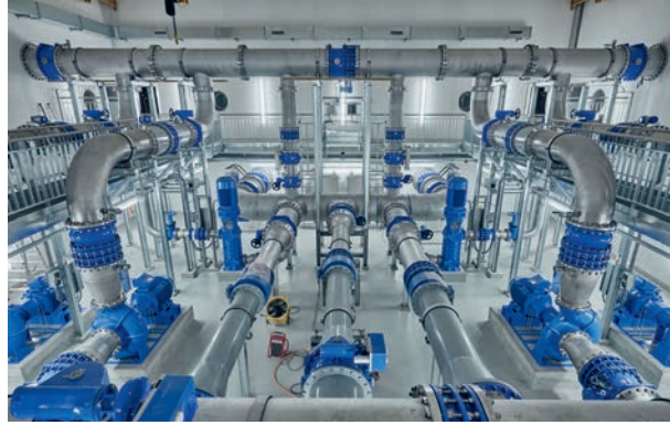
Wasserverteilung im Reservoir Mannenberg