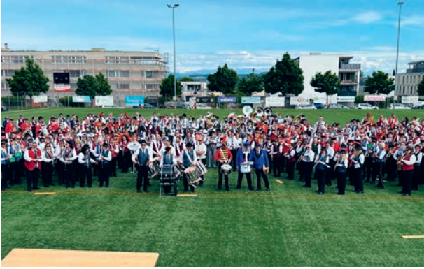
Musiktag 2025: Gesamtchor auf dem Geisshubel