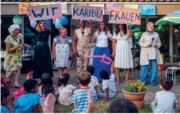
Theateraufführung am KARIBU-Sommerfest