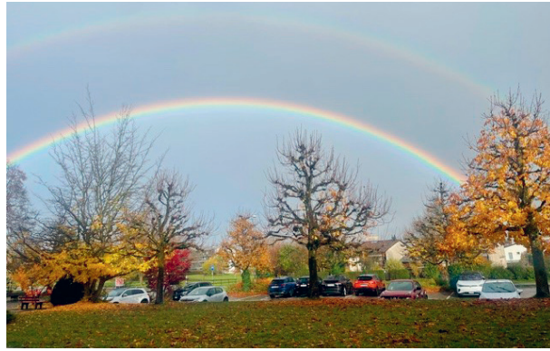
23. Oktober 2025: Regenbogen vor der Gemeindeverwaltung