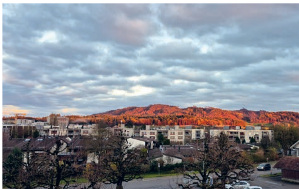
Herbststimmung in Zollikofen mit Blick ins Grauholz