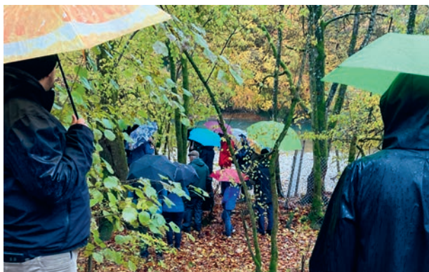
Bei Regen unterwegs am Biodiversitätsspaziergang