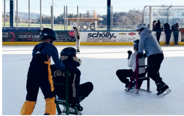
Wahlacker-Klassen beim Schlittschuhlaufen im Hirzenfeld