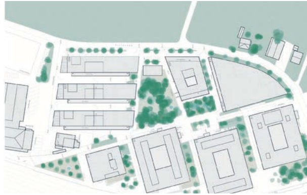
Masterplan Meielen (Bundesbauten)

Sowohl erfahrene KI-Nutzende wie auch Neulinge profitierten am Kurs vom Ausprobieren verschiedener Anwendungen und der Wissensstand glich sich etwas aus. Spannend waren zudem die Diskussionen zu ethischen Bedenken und die Klärung heikler Fragen zum Datenschutz. Erklärtes Ziel des Kurses – und der Gemeinde Zollikofen – ist es, Mitarbeitende zu befähigen, KI in ihrem Arbeitsalltag zur Entlastung zu nutzen.