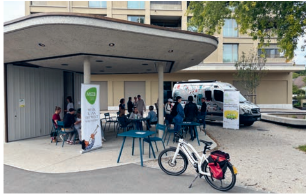
Radiobus Sendetag der Musikschule Zollikofen-Bremgarten

Auch ausserhalb des Schulzimmers bot das Jahr wertvolle Erfahrungen. Die Landschulwoche im Fieschertal sowie abwechslungsreiche Exkursionen ermöglichten es den Schülerinnen und Schülern, Verantwortung zu übernehmen, Gemeinschaft intensiv zu erleben und neue Lernorte zu entdecken. Erlebnisse, die weit über das Schuljahr hinaus wirken. Traditionelle Anlässe wie der «Bsüechlimorge» und der Wellentag unterstrichen die Bedeutung bewusst gestalteter Übergänge: Neue Schülerinnen und Schüler wurden herzlich willkommen geheissen, während sich andere auf ihren nächsten Lebensabschnitt vorbereiteten. Verabschiedungen von Lehrpersonen erinnerten daran, dass Wandel ein natürlicher Bestandteil einer lebendigen Schule ist. Mit dem Schulfest fand das Jahr einen würdigen und fröhlichen Abschluss, getragen von Dankbarkeit und Zuversicht.