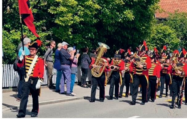
Marschmusik an der Schulhausstrasse