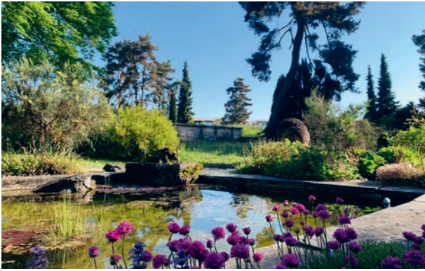
Friedhofteich im Mai