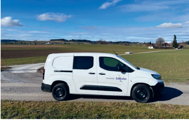
Leise unterwegs mit dem Elektrofahrzeug der Abwasserentsorgung

Die Wasserqualität wird laufend überwacht, unter anderem mit Sensoren für Trübung, pH-Wert, Leitfähigkeit und Temperatur. Mit einem Speichervolumen von insgesamt 30'000 m 3 deckt das Reservoir den durchschnittlichen Tagesbedarf von rund 135'000 Personen und ist damit das grösste Trinkwasserreservoir im Kanton Bern. Es stellt die Wasserversorgung, den notwendigen Wasserdruck sowie die Löschreserve auch bei Bedarfsschwankungen oder Ausfällen sicher.