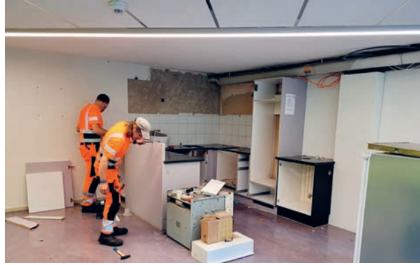
Demontage der alten Gemeindeverwaltungs Küche durch Mitarbeiter vom Werkhof