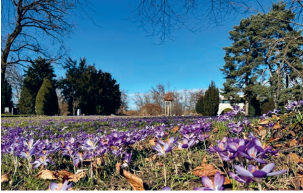
Frühlingsfarben im Friedhof