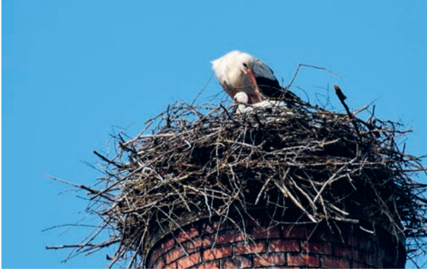
Nachwuchs im Storchennest auf dem Areal der alten Molkereischule