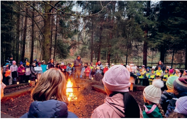
Gemischte Zentral-Klassen bei Projekttagen im Wald